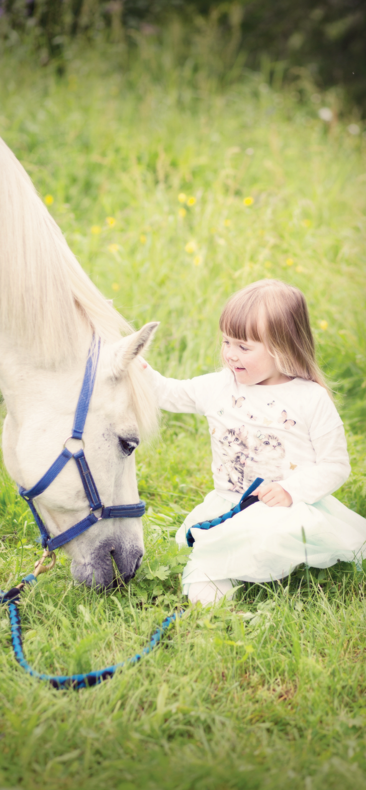
Gode venner. Jente med hest.

og befolkningen i Nordland skal ha tilstrekkelig og kompetent arbeidskraft. Nordland skal også ha et konkurransedyktig, innovativt og bærekraftig arbeids- og næringsliv.