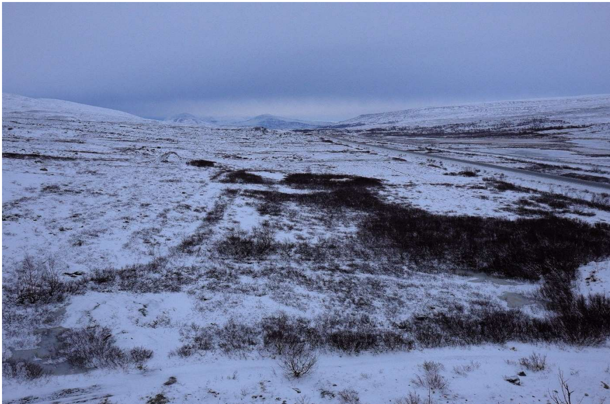
Utsikt over fredningsområdet mot nord, tatt fra toppen av Sukkertoppen oktober 2020.

Området som foreslås fredet utgjør et høyfjellsområde på om lag 171 000 kvadratmeter (1,7 km 2 ). Området ligger på ca. 680 m.o.h., med den svært karakteristiske Sukkertoppen liggende i områdets sørøstlige del. Terrenget er hovedsakelig flatt eller svakt hellende i retning vest-øst. Store deler av området er bevokst med vierkratt og lave fjellbjørker, samt lyng og mose. Området hvor gravplassen lå i fredningsområdets nordvestlige del, er hovedsakelig bevokst med lyng og mose.