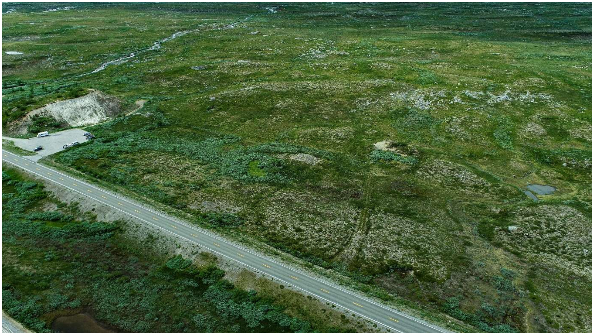
Dronefoto av fredningsområdet i juli 2021. Sukkertoppen til venstre i bildet. Bildet er tatt mot vest.

Deler av fangeleirområdet har blitt høvlet ut for å unngå skavldannelser om vinteren, men spor etter tuftene synes fortsatt.