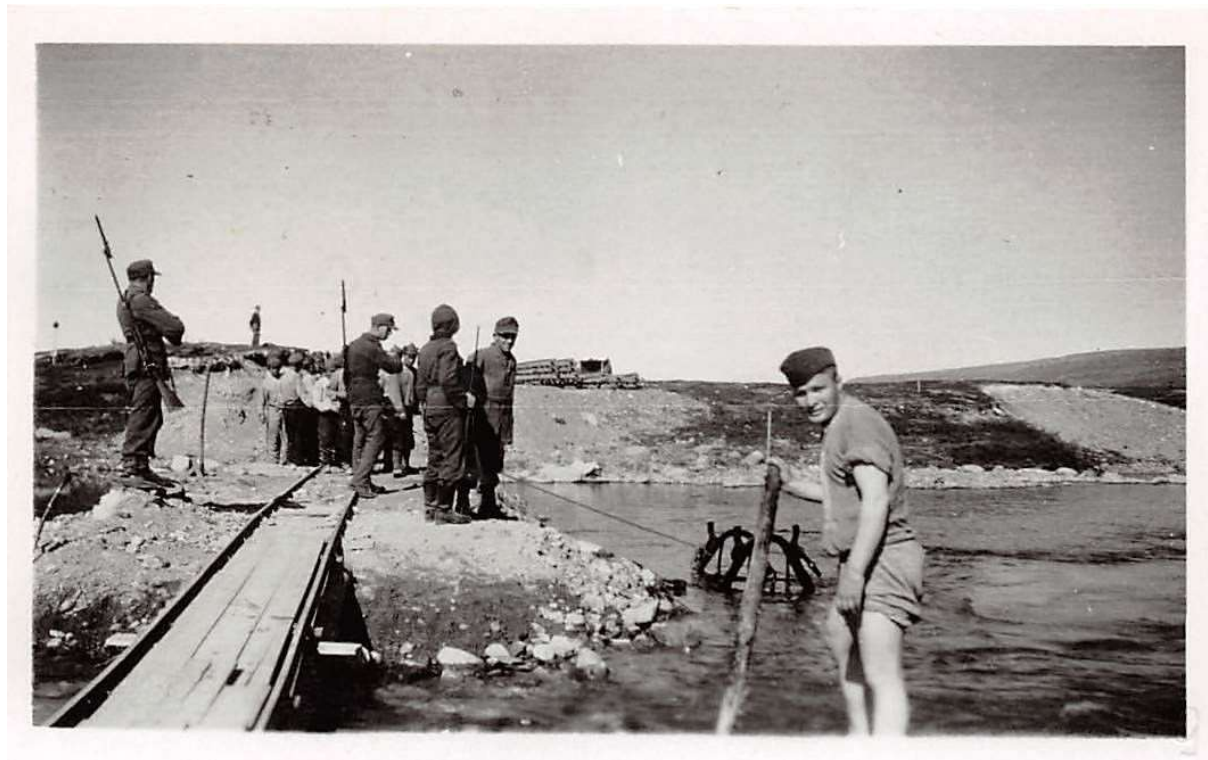
Foto som viser tyske soldater og fanger i arbeid på jernbanen noen kilometer nord for Bjørnelva.

Krigsminnene på Bjørnelva vurderes til å være et helhetlig kulturmiljø tilknyttet andre verdenskrig. Her ser man også tydelig sammenhengen til hva fangene jobbet med ved at E6 og Nordlandsbanen går forbi i umiddelbar nærhet. Sporene ligger i dag som ruiner og tufter i et ellers urørt høyfjellslandskap (med unntak av E6 og Nordlandsbanen) og framkaller en sjelden høy opplevelsesverdi tilknyttet kulturmiljøet.