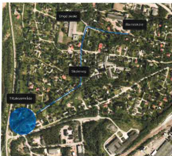
Figur 1 Tiltaket lokalisert ca. 1 km fra barne- og ungdomsskole

Oversiktskart som viser prosjektets plassering i forhold til skoler e.l.