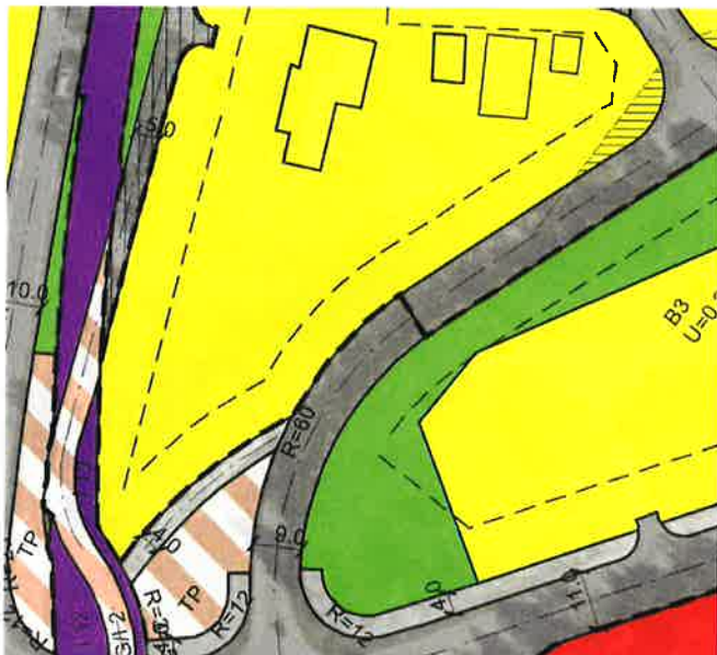
Figur 1 Gjeldende reguleringsplan hjemler ikke fremføring av gang og sykkelveg. Det må derfor utarbeides ny plan