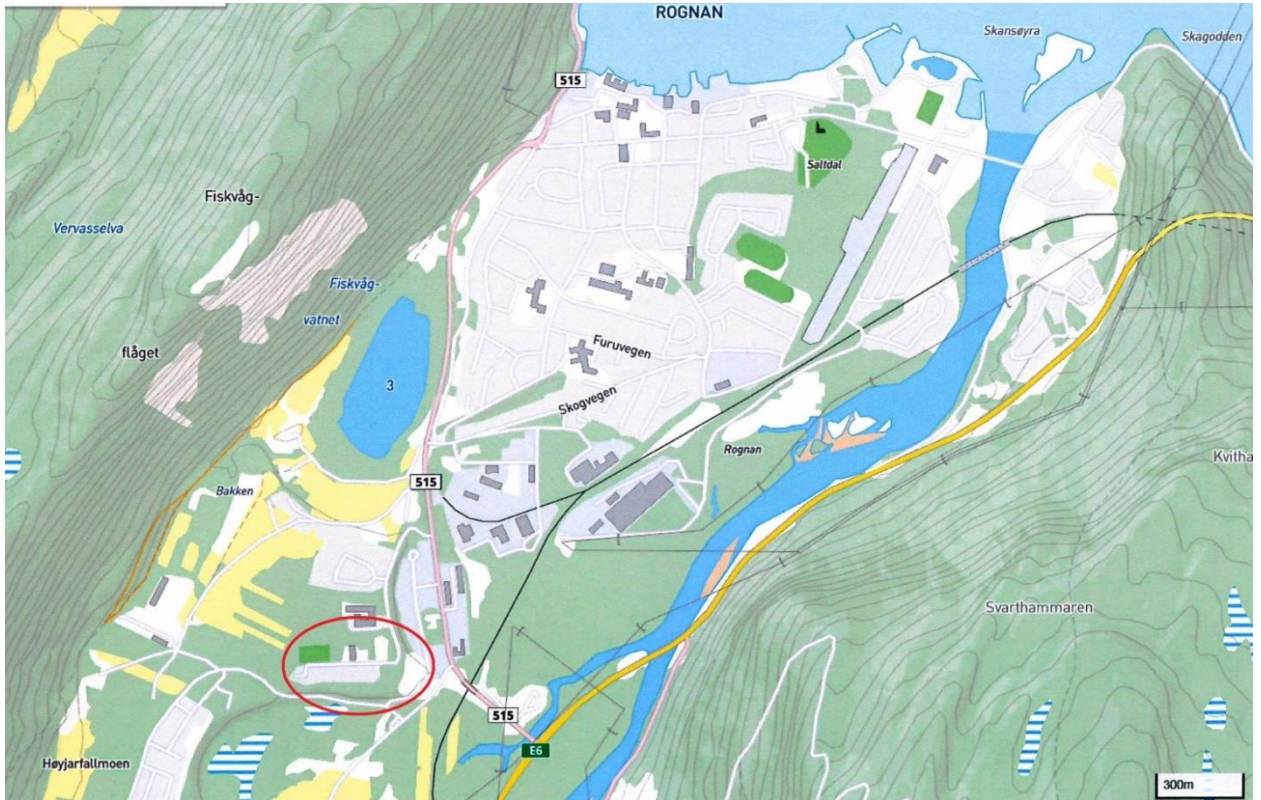
Planområdet markert med rød sirkel