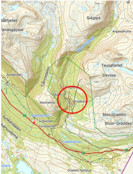
Planområdet beliggenhet, vist med rød ring.

Skaiti, Saltdal kommune, Eiendommer gnr/bnr 0/0, 70/1, 70/2, 70/2/3, 70/3, 70/14, 70/19, 70/20, 70/21, 70/24, 70/25, 70/26, 70/27, 70/28, 70/29, 70/30, 70/31, 70/32, 70/33, 70/34, 70/36, 70/37, 70/59 og 70/60. PlanID 2021004.