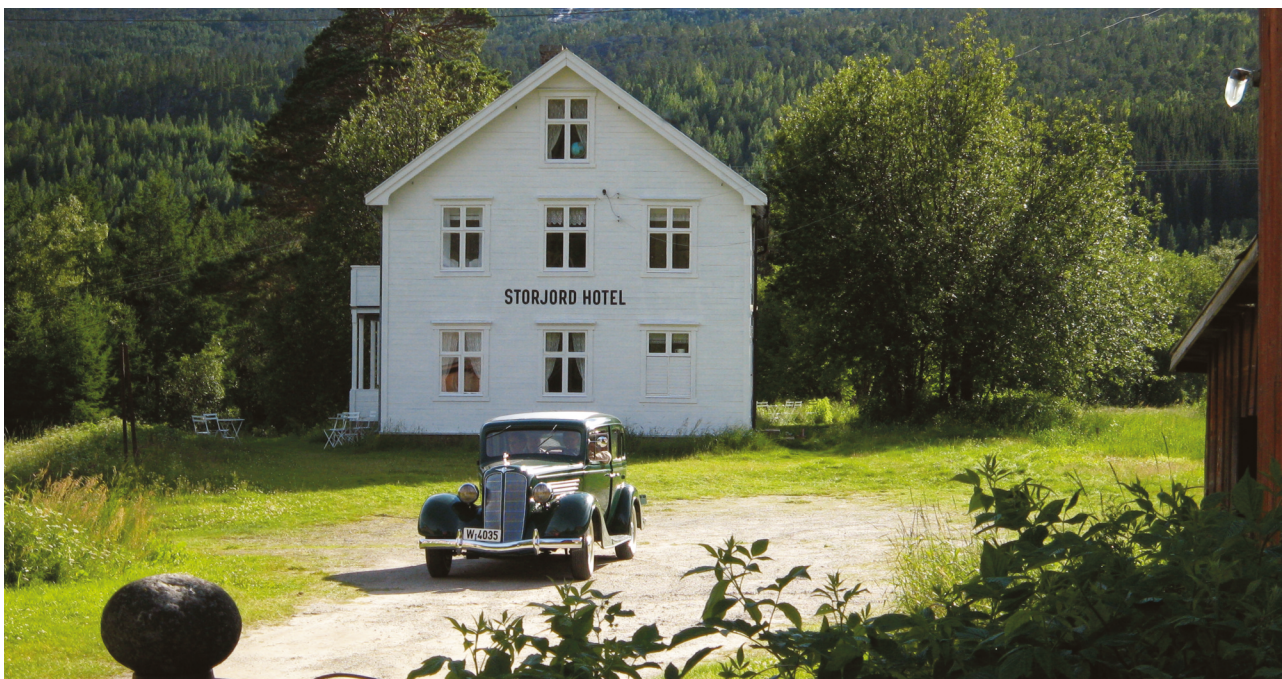
Det gamle trehotellet er varsomt restaurert.