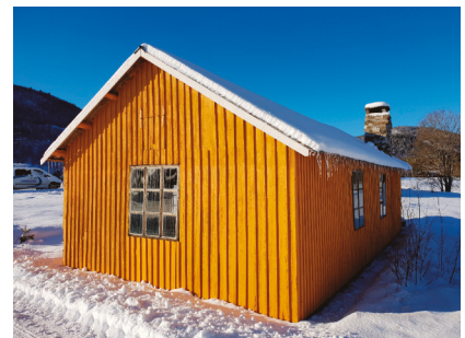
Båtskytte og eldhus i Nordnes.

Fra slutten av 1800-tallet ble det bygd mange skogshusvær og de første