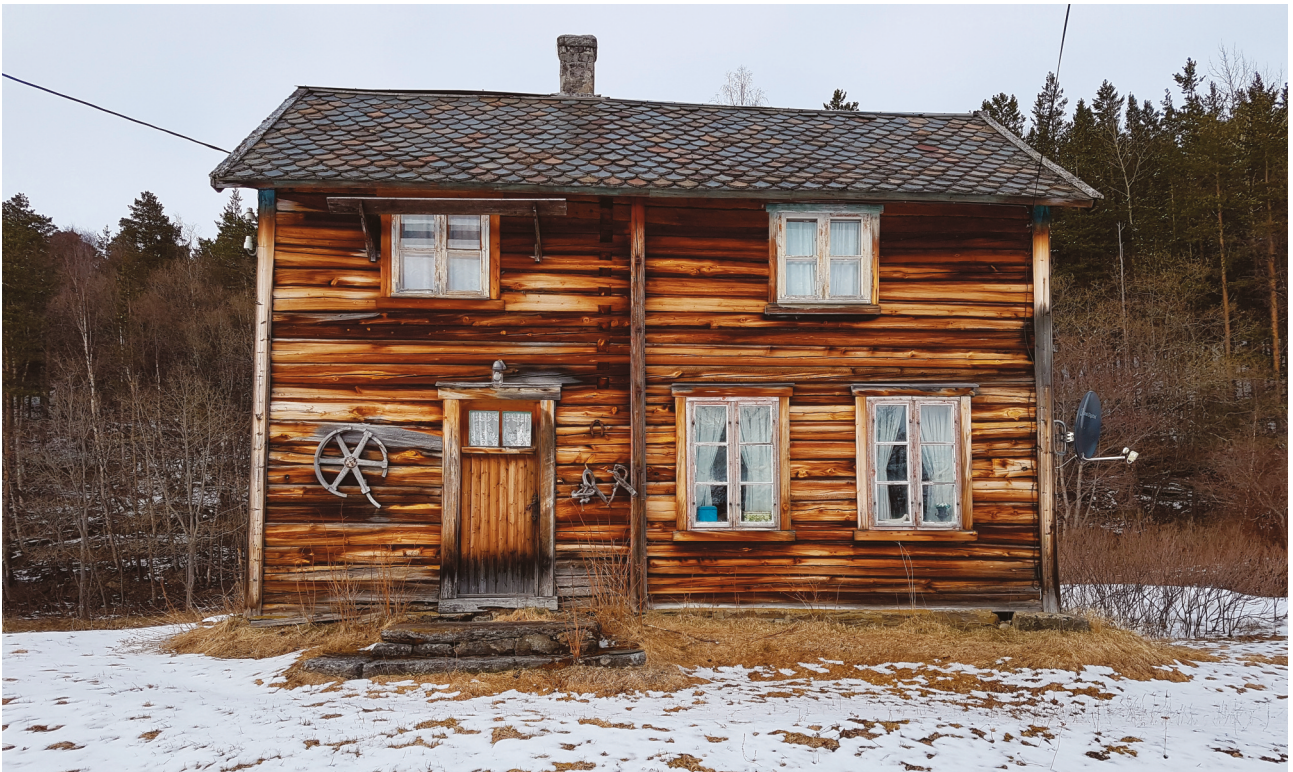
Bolighuset på Lifjell.