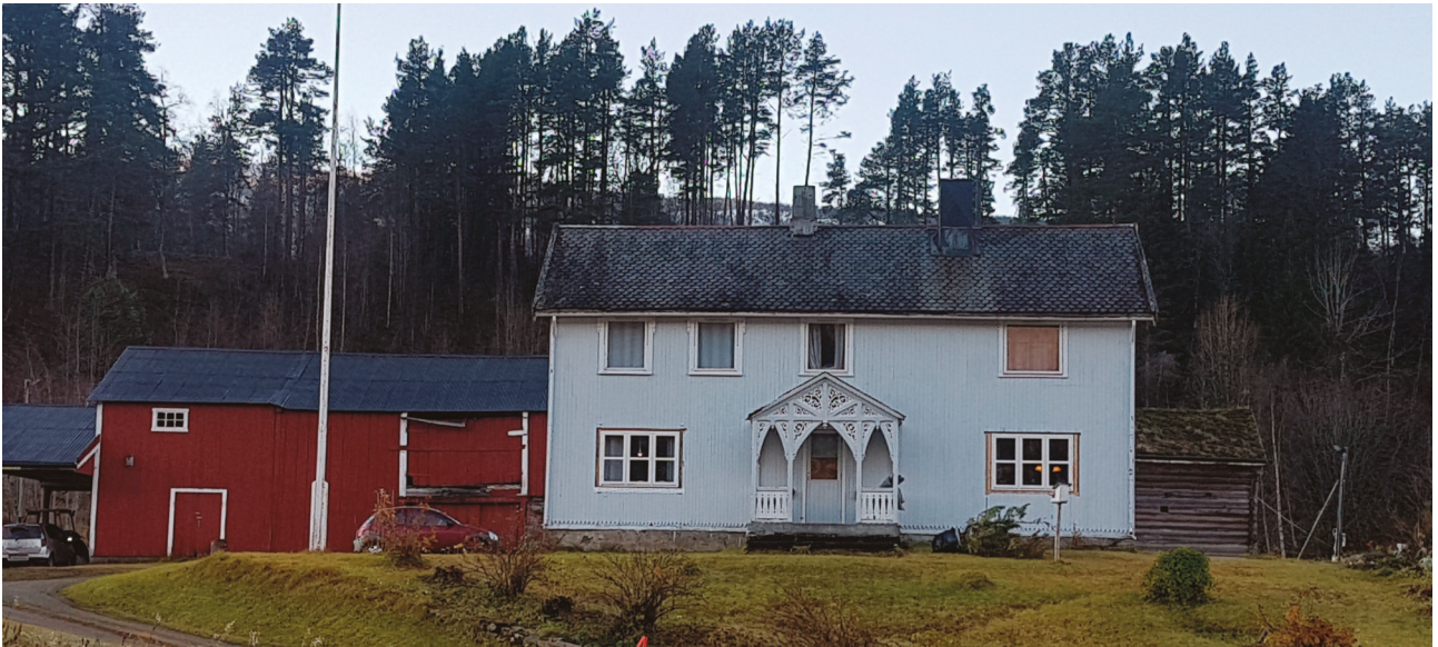
Oldgård på Drageid er et godt bevart gårdstun fra tidlig 1900-tall. Stabburet bak til høyre er bygd før 1650 og automatisk fredet.