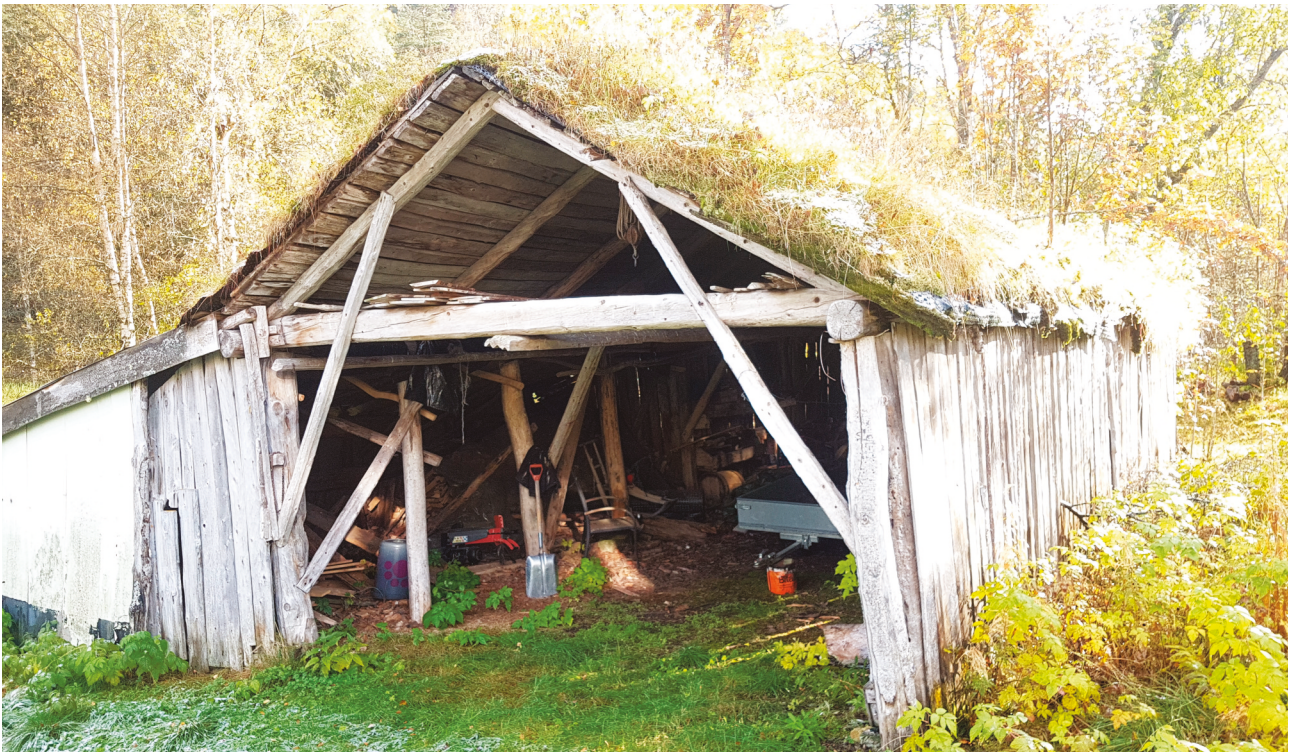
Båtskytta på Jobakkane i Storalmenningen er fra midten av 1800-tallet.

også innslag av pitesamisk byggeskikk. I området er også rester av reingjerde og mange andre kulturminner.