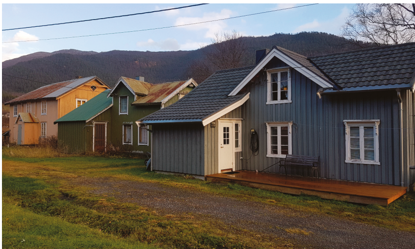
Bolighus i rekke i Ytre Saksenvik. Typiske for perioden etter utskiftingen av klyngetunet.

Bolighuset er av de best bevarte i Saksenvik, Det har en tradisjonell form, med en tømret kjerne og med sval bygd i reisverk mot nordøst. Svala er kledd i en grovere tømmermannskledning, for å markere at det er uthus. Bygningen står i rekke med to andre bolighus og har stor miljøskapende verdi.