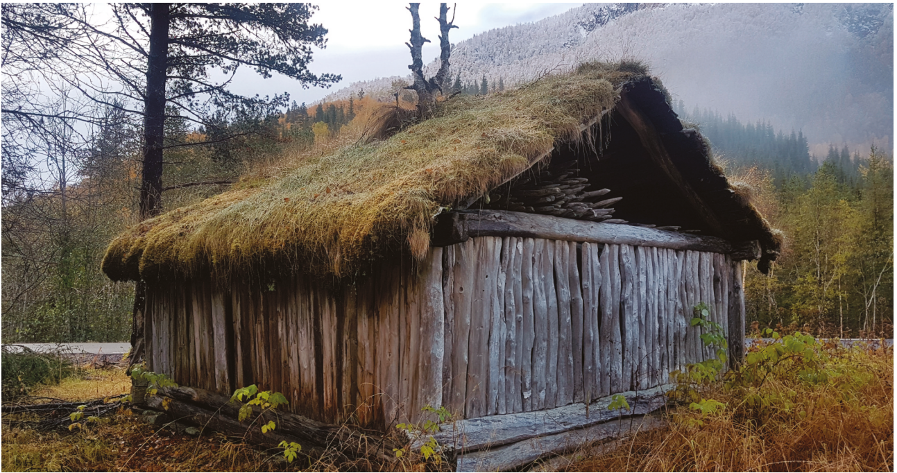
Høyskytte bygd i skjelverterk, på Evensgård.