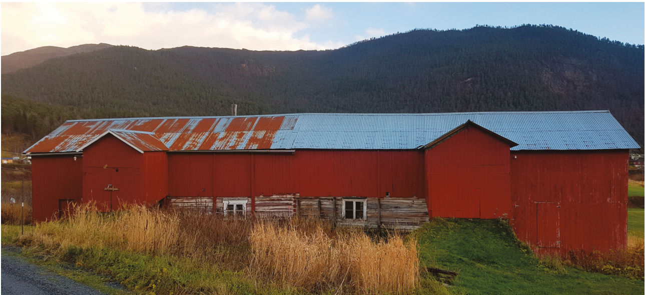
Det lange og lave fjøset bygd om lag i 1885 er satt opp for to brukere, og er innvendig adskilt.