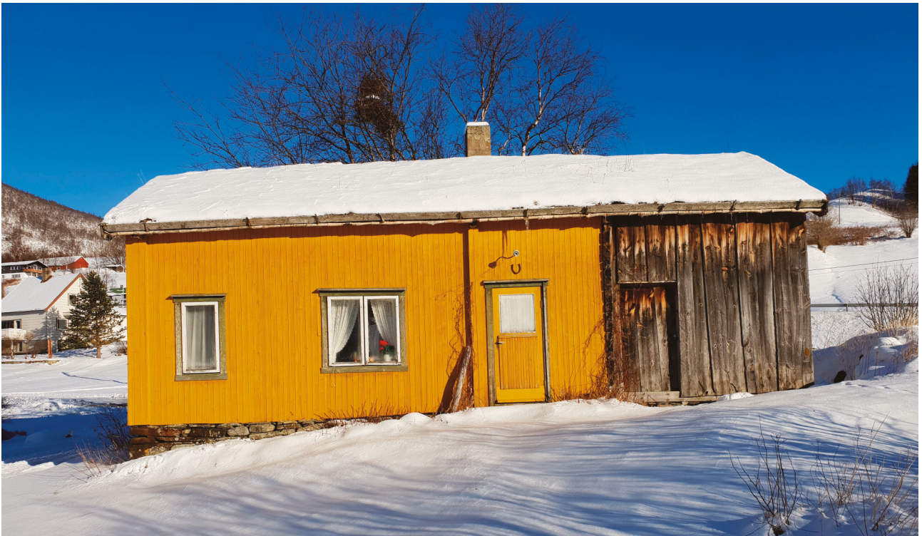
Bolighuset på Setså, ett av få i Saltdal bevart med grue.

eldste seterhuset bygd omkring 1870. Seterdrift var ikke vanlig i Salten, og Grønlietra er ett av få unntak vi kjenner.