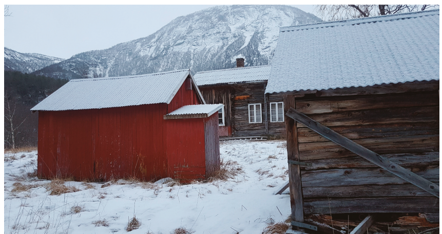
Bolig, fjøs og sjå på husmannsplassen i Botnvatn.

Gammen er bygd av nordsamene som begynte å bruke beiteområdene på Saltfjellet etter 1920. Gammen har