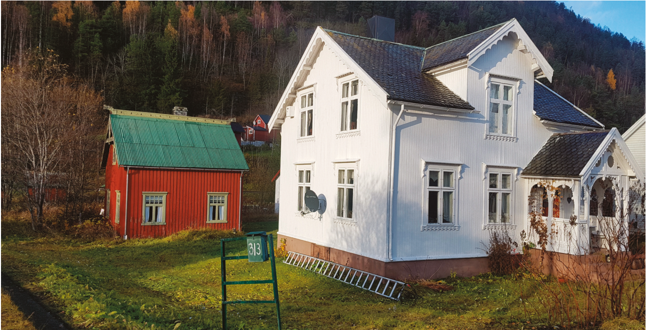
Boligen er ett av de fineste eksemplene på den rike boligarkitekturen.