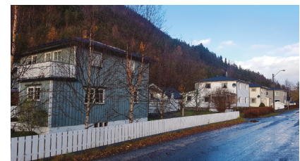
Den nordre delen av Dalvegen.

Bolighuset er av typen nordlandshus, med skifertaket, panelet og vinduene bevart. Boligen danner den visuelle avslutningen av Tyrivegen når man kommer østfra, og har en viktig miljøskapende funksjon.