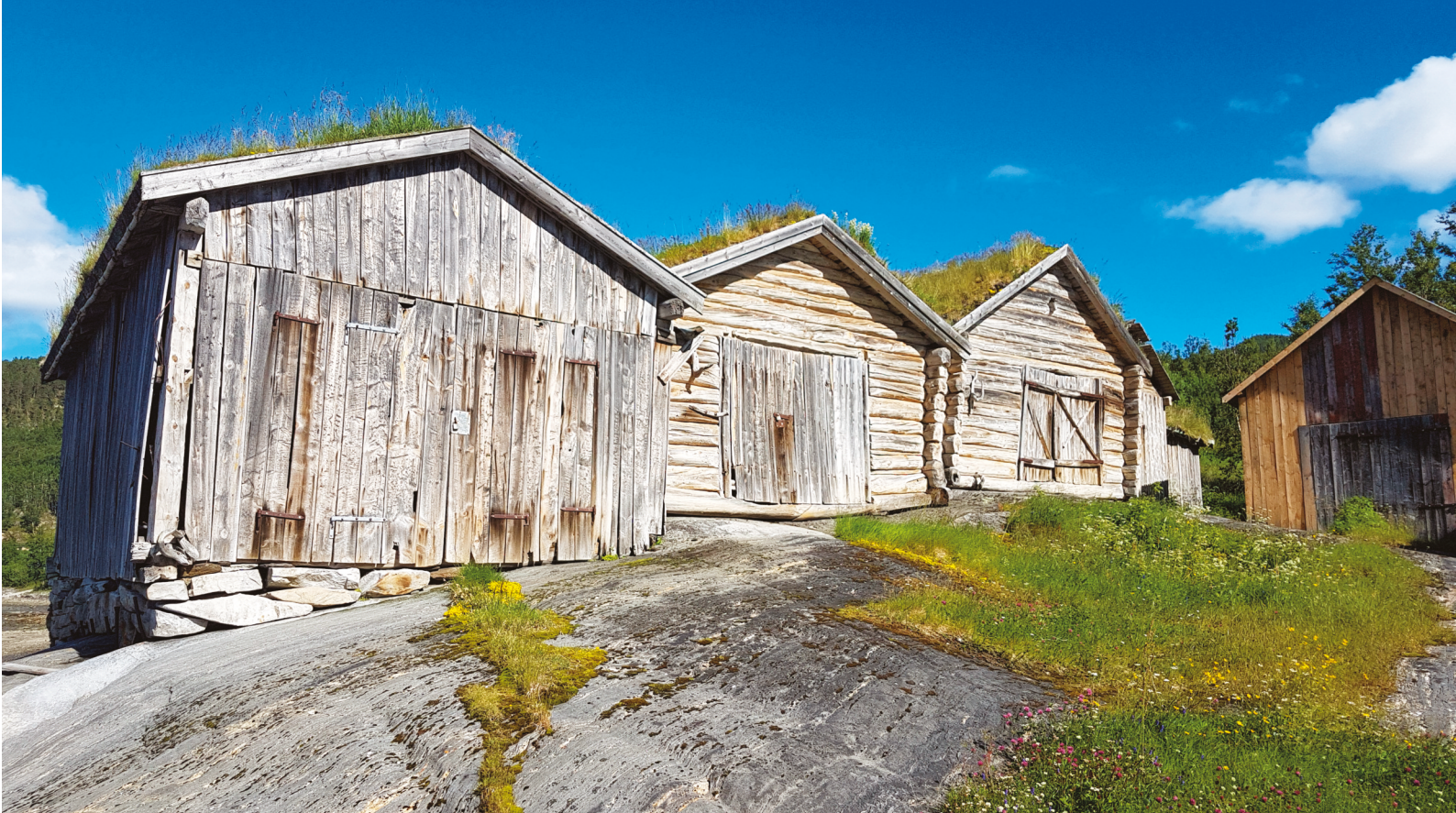
Naustklyngen i Saksenvik er et kjent og sjeldent kulturmiljø.