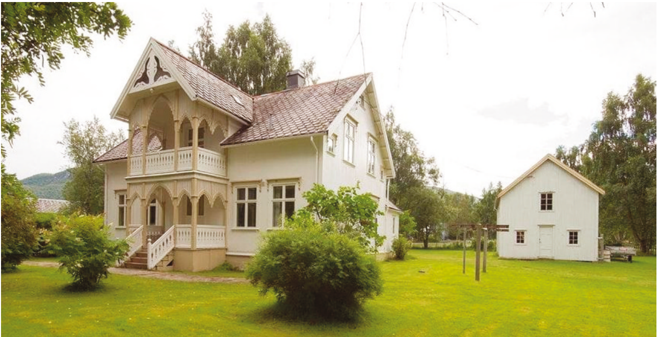
Kranegården, eksempel på Saltdals rike boligarkitektur.