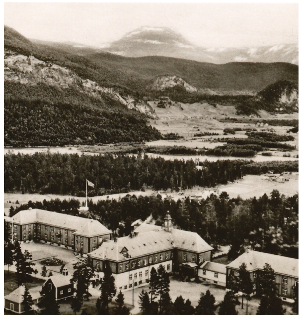
Eldre oversiktsbilde av Vensmoen.