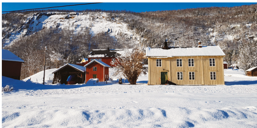
Fjøs, båtskytte, stabbur, bolighus.

Gårdsvegene på Røkland er for en stor del bevart og de er et viktig trekk ved gården. Sørøver på bnr 1 går det en gammel ferdselsveg mellom våningshuset og eldhuset, den minner om en alderdommelig hulveg. Kulturlandskapet er fortsatt velpleid, og det er viktig å sikre omgivelsene til og forbindelsene mellom de bevaringsverdige bygningsmiljøene.