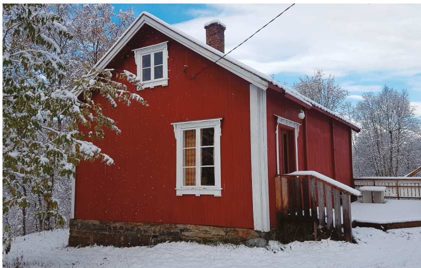
Skolehuset i Evenesdal er i bruk som grendehus.

Røklandsmoen. Støttene ved Krokelva og Bjørnelva ble sprengt i 1950, i seg selv en sterk historie om etterkrigstida. Minnestøttene har høy kulturminneverdi og det må sikres en forsvarlig forvaltning.