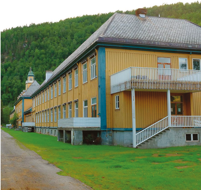
Hovedbygningen på Vensmoen.