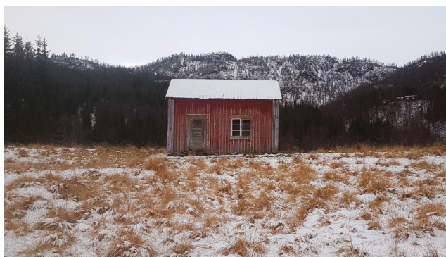
Det gamle bolighuset i Øvergården.

«Lappvegen» er en sti og hulveg som strekker seg fra Medby til Tverråmoen. Noen steder lett synlig, andre steder ødelagt av vegbygging. Navnet forteller om samisk bosetting og bruk av vegen. Vegen er antakelig veldig gammel, førreformatorisk og fredet. Lokalt på Tverråmoen er det fine gårdsveger, eldre og nyere skogsveger, og ferdsselsårer både mot Misvær, Skar, Sundby og Drageid.