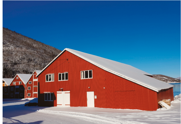
Hansennaustet, båtbyggerverksted fra etterkrigstida.