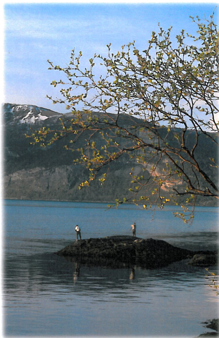
Fisking ved skipmannvik

Eieren av det enkelte anlegg er ansvarlig for drift og vedlikehold. I forhold til anlegg som har fått statlige spillemidler forutsettes det at retningslinjer for tilskuddsordningen angående drift og vedlikehold følges. Kommunen kan bidra til bedre tilrettelegging av skitilbudet gjennom å inngå avtaler om løypepreparering med idrettslagene. Kommunen kan likedan bidra til tilrettelegging av isflater som nærmiljøanlegg gjennom samarbeid og avtaler med velforeninger, lag etc. der ansvar og ressursbruk er avklart