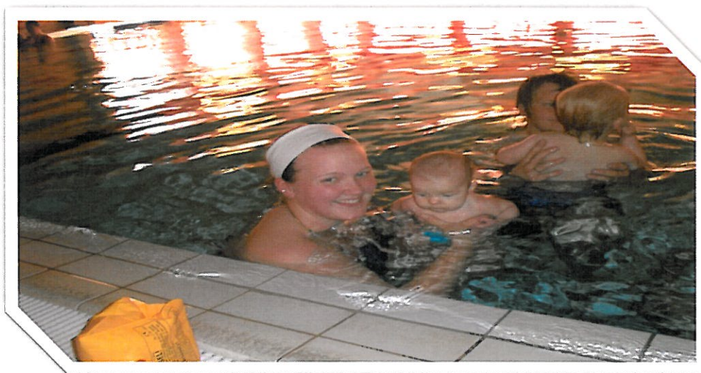
Babysvømming i Røkland Svømmehall

Saltdalshallen har trangt med lagringsplass, og det er ønskelig med et lagerbygg. Dette er noe som står på prioritert liste.