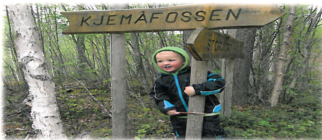
Fra trimkasse tur til Kjemåfossen