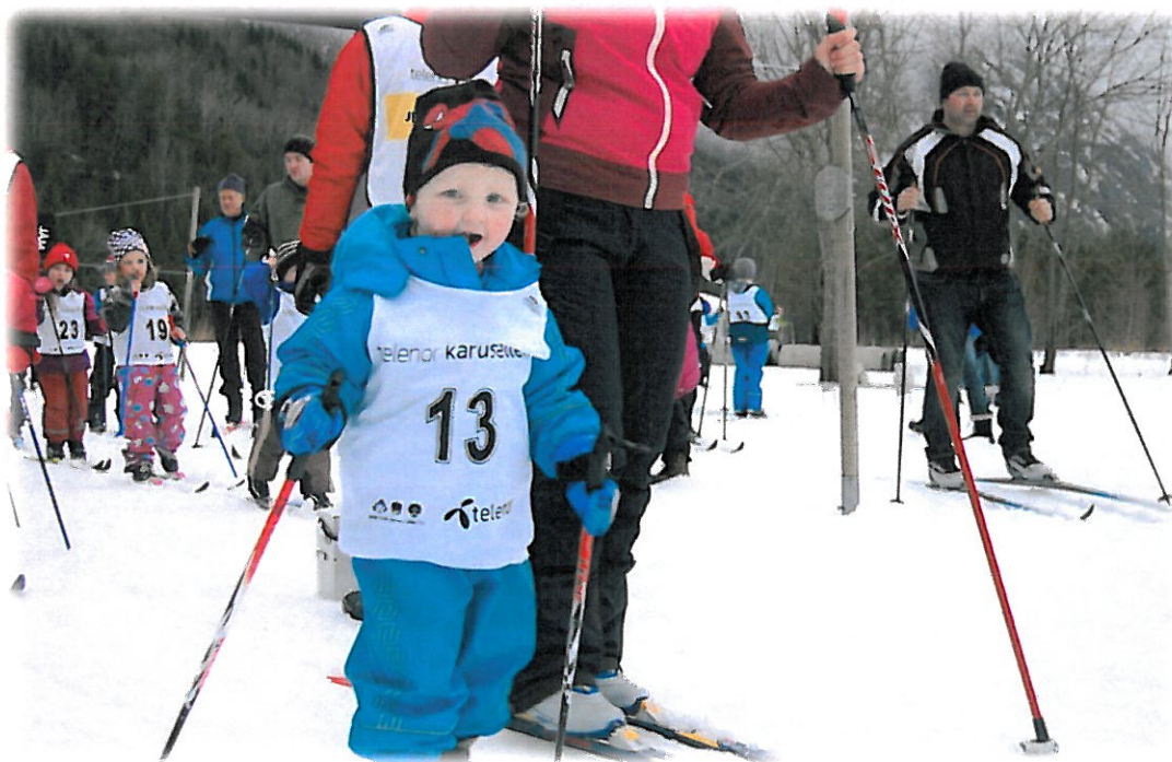
Telenor Karusellen var et veldig populært for barn og ungdom vinteren 2012

Det kan virke som at de som er i yrkesaktiv alder, har en travel hverdag. Da er det viktig at barnehagen og skolens satsing på fysisk aktivitet blir viktig, dette for å nå våre mål om en bedre helse for barn og unge. Fysisk aktivitet og naturopplevelser er et samarbeid mellom mange private og kommunale instanser her i kommunen. Vi må jobbe for at vi skal bli bedre til å bevege oss og komme oss ut i naturen, dette for å skape trivsel og økte naturopplevelser. Friluftsliv viser seg å være en foretrukket form for fysisk aktivitet for mange nordmenn.