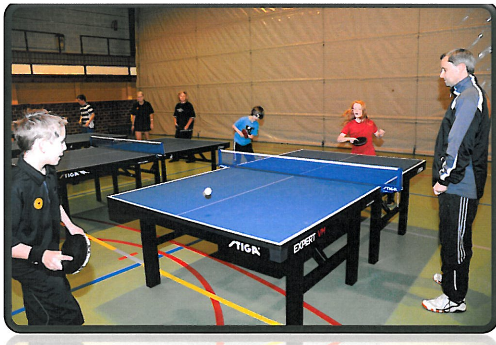
Bordtennis er blitt en stor idrett i Saltdal, her fra en trening i Saltdalshallen

Saltdal kommune bruker ca. 3 mill. til vedlikehold og drift av anlegg for idrett og friluftsliv. Dette er tall som er tatt fra KOSTRA. ( K ommune- S tat- R apportering) er et rapporteringssystem for norske kommuner og brukes på nasjonalt nivå. Systemet benyttes for å rapportere informasjon om kommunale tjenester og bruk av ressurser på ulike tjenestoområder i hver enkelt kommune. Denne informasjonen sendes Statistisk sentralbyrå (SSB) som publiserer det.