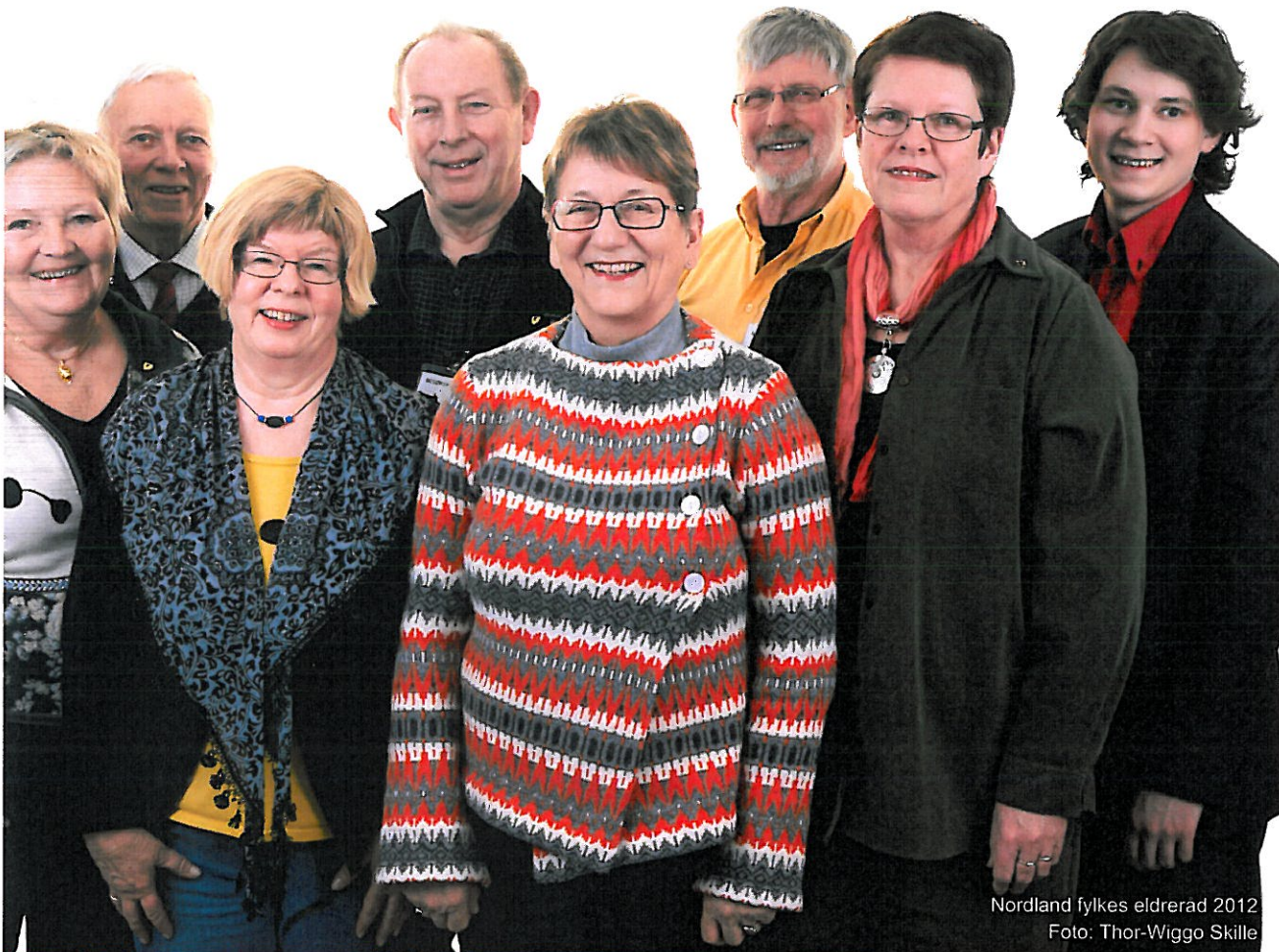
Nordland fylkes eldreråd 2012