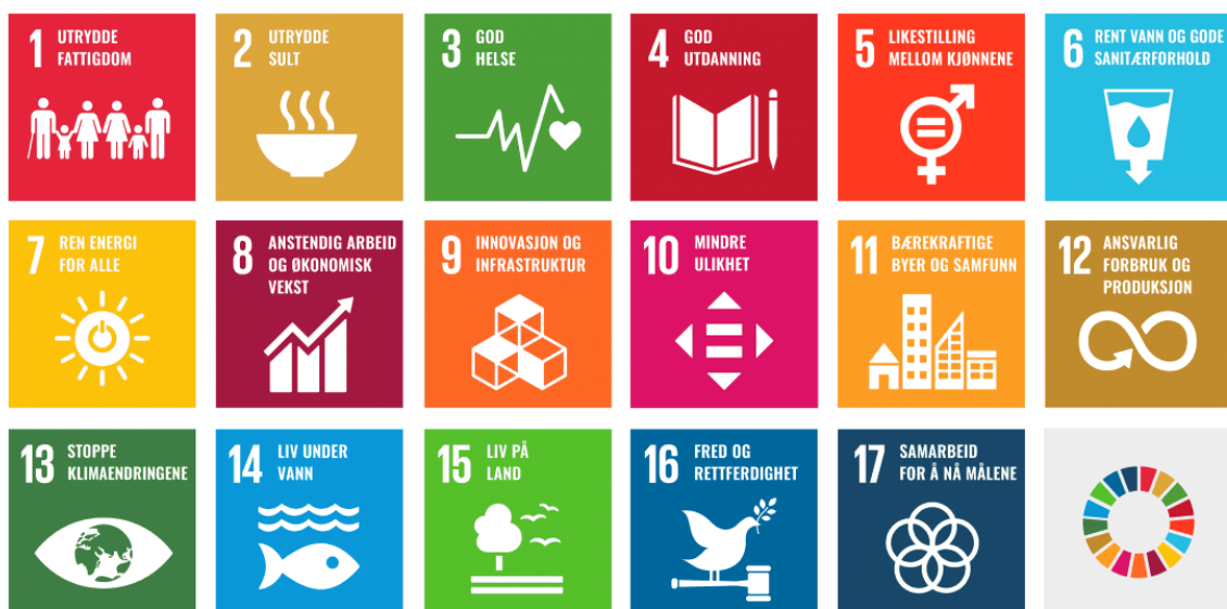
Figur 2. FNs bærekraftsmål.

Av nasjonale føringer ligger FNs bærekraftsmål til grunn og nasjonale forventninger til regional og kommunal planlegging til grunn. Sistnevnte legger vekt på at vi står overfor fire store utfordringer: å skape et bærekraftig velferdssamfunn, å skape et økologisk bærekraftig samfunn gjennom blant annet en offensiv klimapolitikk og en forsvarlig ressursforvaltning, å skape et sosialt bærekraftig samfunn og å skape et trygt samfunn for alle. Regjeringen har bestemt at bærekraftmålene som Norge har sluttet seg til, skal være det politiske hovedsporet for å ta tak i vår tids største utfordringer, også i Norge. Det er derfor viktig at bærekraftmålene blir en del av grunnlaget for samfunns- og arealplanleggingen. Dokumentet beskriver videre planlegging som verktøy for helhetlig utvikling, vekstkraftige regioner og lokalsamfunn i hele landet, bærekraftig areal- og transportutvikling, byer og tettsteder der det er godt å bo og leve og statlige planretningslinjer og statlige planbestemmelser. Hvert av områdene er tydeliggjort med hva som er regjeringens forventninger til disse overskriftene.