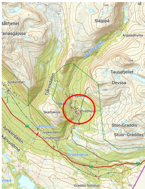
Planområdets beliggenhet, vist med rød ring.

Planområdet ligger i Skaiti i Saltdal kommune. Planområdets beliggenhet og avgrensning er vist i kartutsnittene under. Planavgrensningen følger i hovedsak gjeldende reguleringsplan. Det er foreslått å inkludere deler av Skaitiveien, Pv99288 og Kv40141 i planområdet. Eiendommer som berøres helt eller delvis av planområdet er gnr/bnr 0/0, 70/1, 70/2, 70/2/3, 70/3, 70/14, 70/19, 70/20, 70/21, 70/24, 70/25, 70/26, 70/27, 70/28, 70/29, 70/30, 70/31, 70/32, 70/33, 70/34, 70/36, 70/37, 70/59 og 70/60.